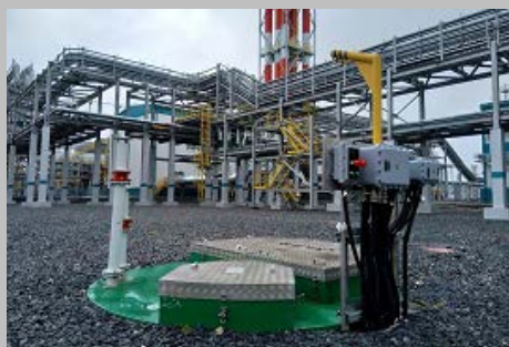
Производство и поставка 30-и комплектных КНС ПАО "СИБУР Холдинг" Западно- Сибирский Нефтехимический комбинат Г. Тобольск