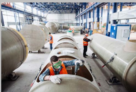
Производство г. Тольятти